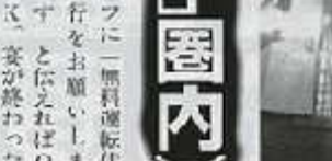
アスタグループが平成代行社に電話をすれば、何ともうれしい話題。