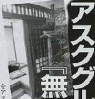
アスタグループがスタートしてすぐ、グルーブ6店でも、利用して

また、代車だけでなく、タクシーで帰宅する人には平成ハイヤー1000円分を店側が負担してくれる。さらに、10名以上の団体で宴会コースを申し込むと、バスで無料送迎もしてくれる。05年から07年の忘新年会はアスタグループで決ま